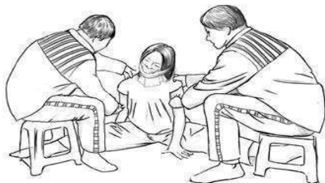
酷刑示意图四：双腿强行一字劈开。

看到刑事犯扔的垃圾袋中有血淋淋的纸或布，这充分说明还有更令人发指的迫害没被曝光出来。